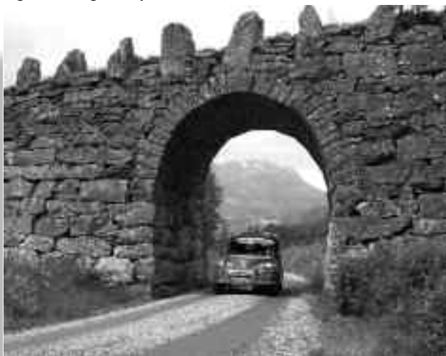
Et glimt af den gamle vej