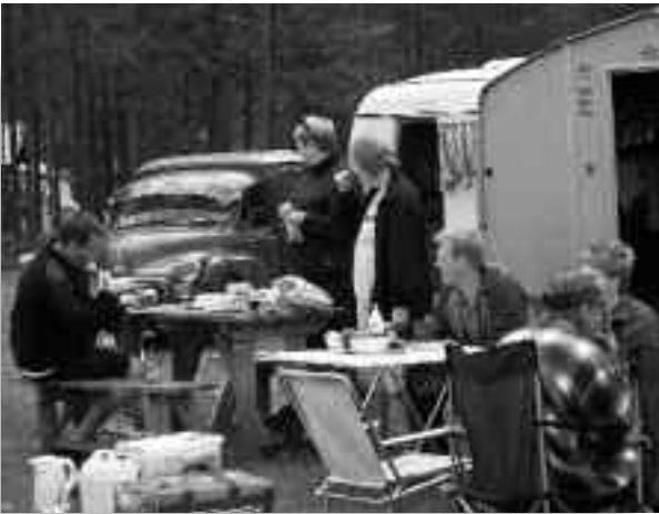
Aftenhygge under træffet.

Der var klart nogen der fik sig en overraskelse over vejene navnlig dem med campingvogn. Dem, der kunne huske treffet i Ålesund for 15 år siden, havde ligesom helt tilfældigt valgt at bo i telt eller hytte eller højest taget en lille teltvogn med.