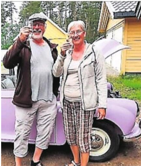
De seg på å feire at Morrisen førstnevnte kjøpte i 1973 omsider er ferdig restaurert, etter