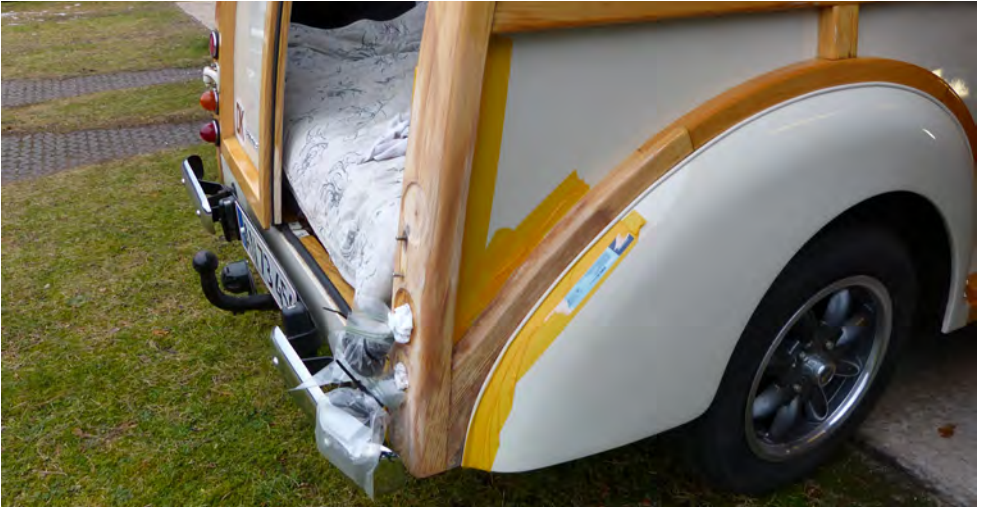
Højre side ved start

I oldtiden brugte man ask til skafter, stiger, spyd og buer. I de første flyvemaskiner og automobiler blev stellet bygget af asketræ.