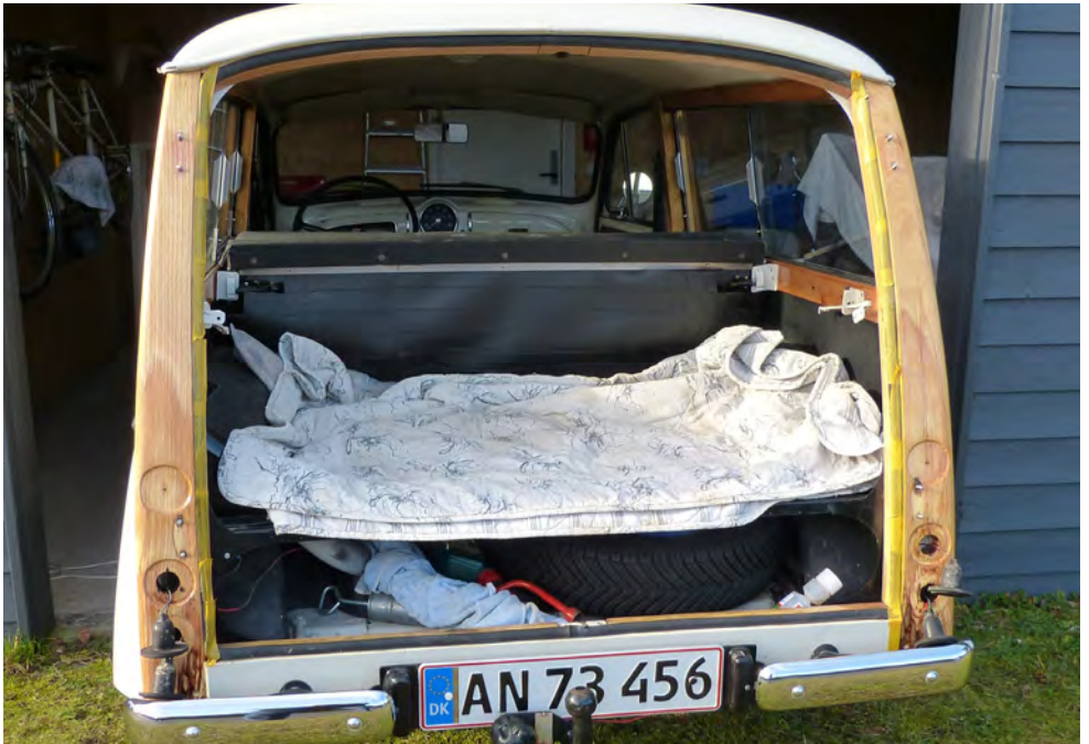
Linoliebehandling 3. gang