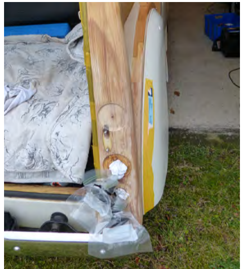
Træværk venstre og højre side efter slibning