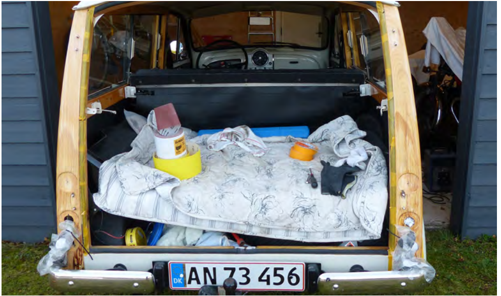
Linoliebehandling 1. gang