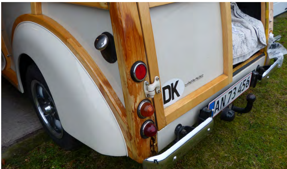
Træværk venstre side ved starten